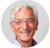
Ronald Cohen President of the Global Steering Group for Impact Investment(GSG)