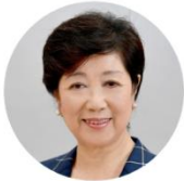
小池 百合子 東京都知事