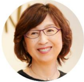
南場 智子 日本経済団体連合会 副会長 Founder/Executive Chairman at DeNA Co., Ltd.