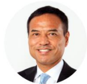
新浪 剛史 サントリーホールディングス 代表取締役社長